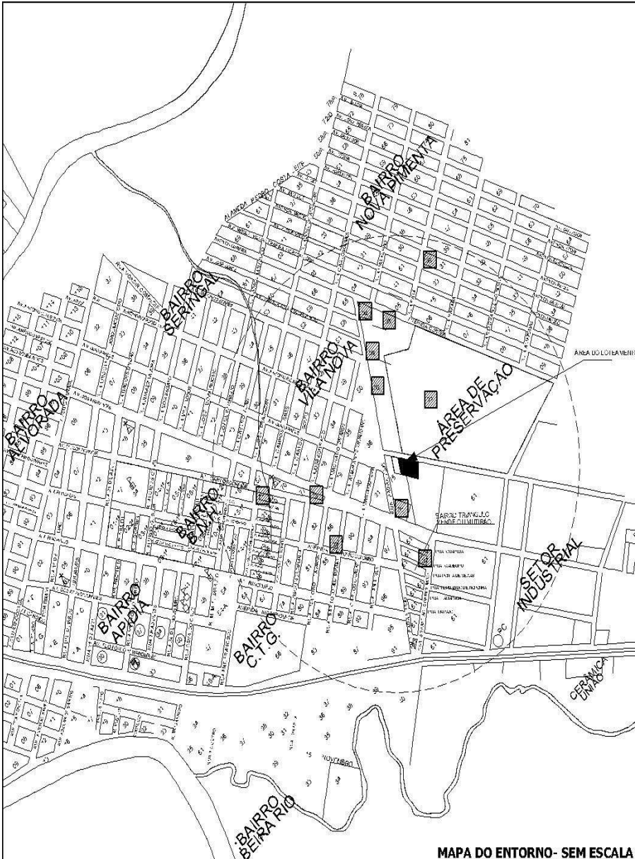
MAPA DO ENTORNO - SEM ESCALA

Av. Castelo Branco, n.º 1046 – Pimenta Bueno/RO – Cep.: 76.970-000 – Fone/Fax: (69) 3451-2593